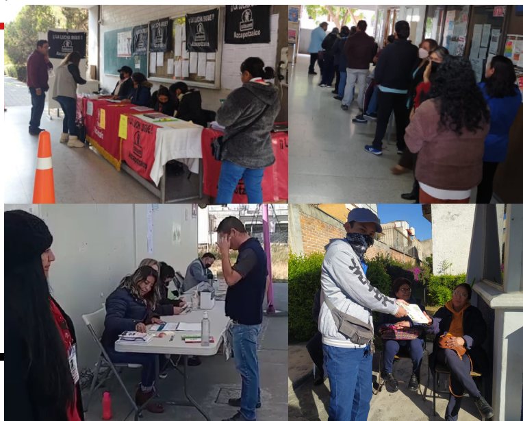
Proceso de consulta. Comisión de Legitimación. 12 y 13 de diciembre de 2022.

Una vez más el SITUAM demuestra su Unidad en la Lucha Social.