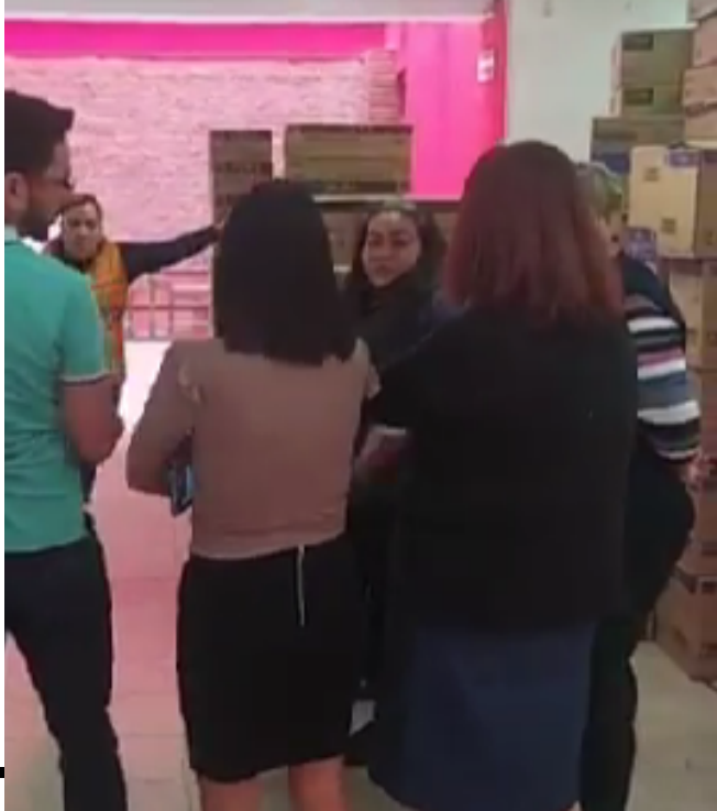
Entrega de juguetes en el Local Sindical. 07 de diciembre de 2022.

Entrega lunes 19 y martes 20 de diciembre en todas las unidades.